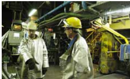
L'industrie et le Bâtiment Travaux Publics