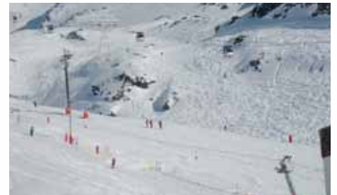
L'économie du tourisme et des services aux entreprises